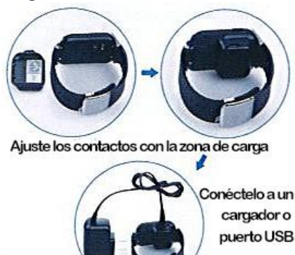
Diagramma di carico:

Bottono home: Per accendere/spegnere l'orologio, mantenendolo premuto, accendere lo schermo di modo riposo, spegnerla, ritornare al menu di inizio.